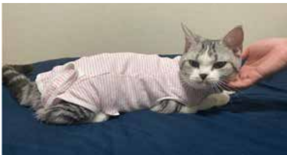
術後、退院初日のビスコちゃん(♀)