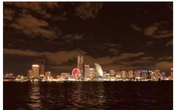
湾上から見た横浜の夜景

1つの船にしか乗った事が在りません。何故かというと、私が高校生～専門学生まで屋形船の従業員としてアルバイトをしていました。なのでアルバイトしていた会社の船が好きです。が正しい言い方になると思います。屋形船の何が良いかというとまずは雰囲気だと思います。自分が働いていた屋形船は掘り炬燵とテーブル席があり、床は畳となっており、和風情を感じられる雰囲気になっています。そして何より横浜の夜景が綺麗で普段、陸地から見ている景色とは全く違った顔を見れるのも魅力です。しかし、そこまではどこの船に乗っても同じ様な物だと思いますが私が一押しなのは、料理です。よく天ぷらの食べ放題とかは耳にしますが、ここはコース料理となっており、直ぐに裏で調理しているので熱々の煮魚や天麩羅を食べる事ができます。